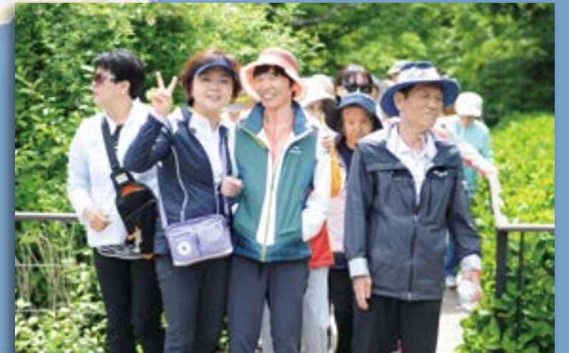
6차 제주여행 에코랜드 산책중~